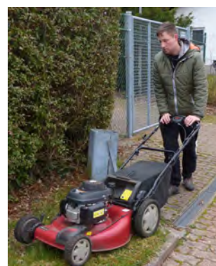
Erster Arbeitseinsatz im März 2021

proaktiv Sport GmbH Hindenburgallee 2 · 63571 Gelnhausen-Hailer