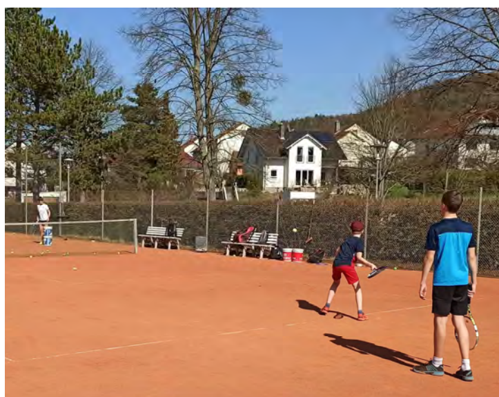
Jugendtraining im März auf den Allwetterplätzen